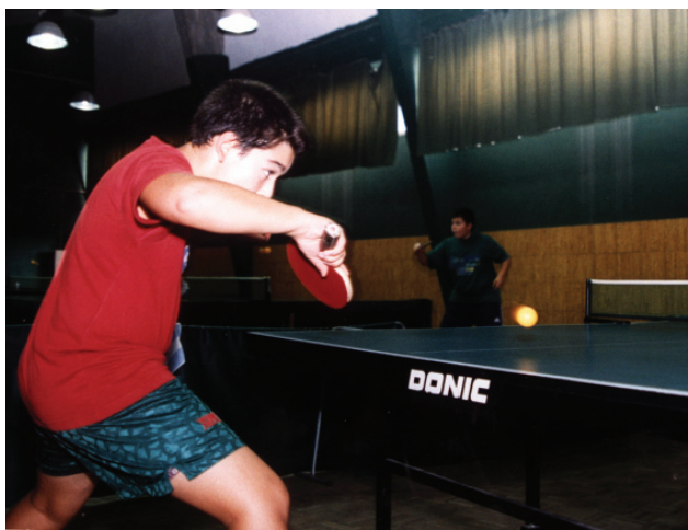
A secção de ténis de mesa conta com mais de 40 atletas

Com todos os escalões representados - desde iniciados a veteranos -, a nova época do ténis de mesa sadino deverá contar com mais de 40 praticantes, entre os quais os que representam as