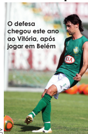
O defensor chegou este ano ao Vitória, após jogar em Belém

De Braga chega um opositor que disputou esta quarta-feira, um jogo de Liga dos Campeões. O cansaço do adversário poderá beneficiar o Vitória? «É um facto que vêm de uma partida exigente, mas a nossa preocupação é que vamos encontrar um Braga muito forte e estamos motivados para vencer».