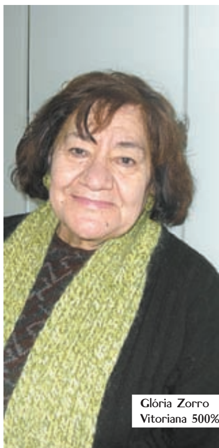
Glória Zorro Vitoriana 500%